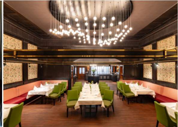
Serviette 80m 2