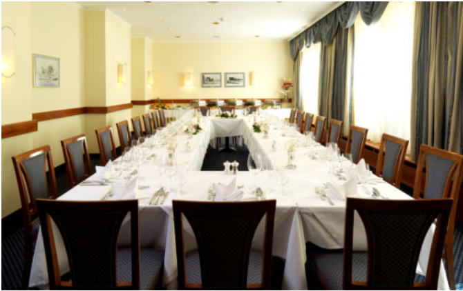
Salon 60m 2